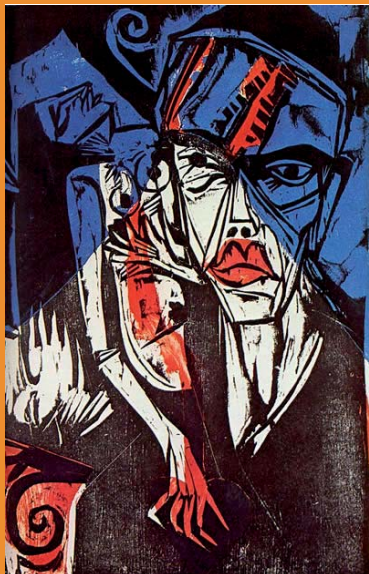
Ernst Kirchner, Combats , 1915

Informazioni più precise saranno pubblicate nella sezione “Notizie ed eventi” del sito www.lettereifilosofia.unimi.it