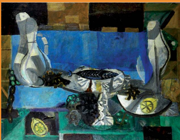
Bruno Cassinari, Il limone , 1952