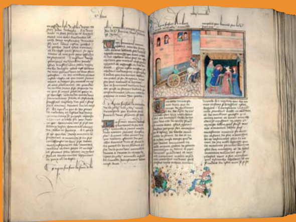
Decameron, Paris, Arsenal, ms. 5070