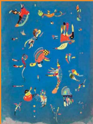
Vasilij Kandinsky, Cielo blu , 1940