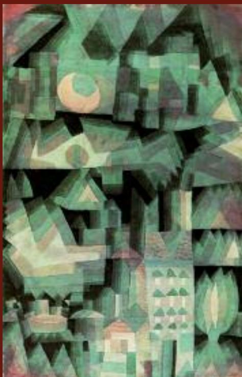
Paul Klee, Giardini del sud , 1936