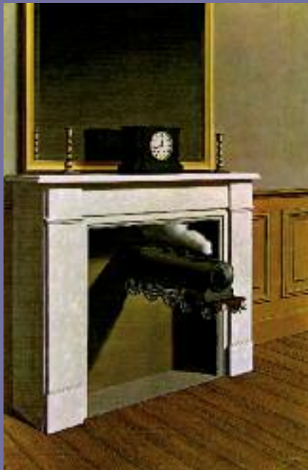
René Magritte, Tempo trafitto , 1938

Mariangela Mazzocchi Doglio (Università degli Studi di Milano) "Tous les Démones de la Judée m'habitent": ispirazione biblica in alcuni drammi di André Gide