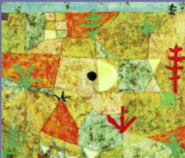
Paul Klee, Citta di sogno , 1921