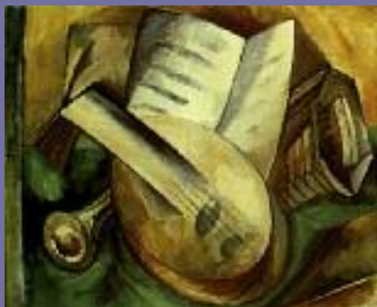
Georges Braque, Strumenti musicali , 1908