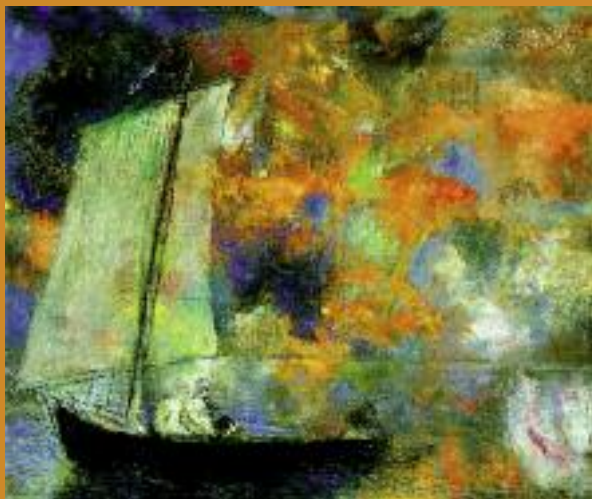
Odilon Redon, Nuvole di fiori , 1903

Dopo avere accompagnato la cultura del lungo Ottocento in tante sue forme, letterarie, musicali e pittoriche, cosa accade a Shakespeare nel momento eversivo delle grandi dissacrazioni e iconoclastie? Per quanto non certo assente dai palcoscenici né indifferente a chi scrive o dipinge, lo Shakespeare del primo Novecento appare radicalmente diverso dal vate ispiratore di tanti romanticismi. Percorsa ora da tensioni contrastanti, contestata e malmenata, la sua opera nasce a vesti e forme nuove per incontrare, spesso in modo drammatico e conflittuale, i linguaggi del moderno. Esplorando un terreno poco noto, il convegno ha interrogato questa fondamentale stagione shakespeariana che si declina in più culture - Francia e Polonia, Russia e Portogallo - e in diversi idiomi - cinematografico, filosofico, teatrale e pittorico.