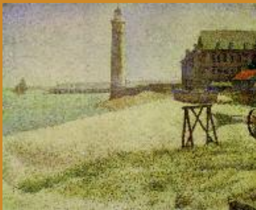
Georges Seurat, Il faro di Honfleur , 1886