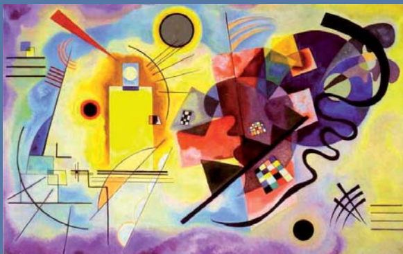
Vasilij Kandinsky, Giallo, rosso, blu , 1925