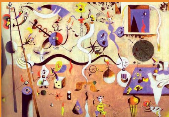
Juan Miró, Il carnevale di Arlecchino , 1924-25

Il convegno continua una tradizione ormai decennale di attenzione di Geografi e Storici dell'Università di Milano, dell'AIIG e di CLIO per gli Insegnanti delle scuole primarie e secondarie. Dopo riflessioni già esplorate su altri temi (il viaggio, i paesaggi cinematografici, la letteratura contemporanea e l'interculturalità), il convegno 2009 concentra la sua attenzione sulle grandi opportunità offerte dalla Cartografia, nelle sue varie forme e nella sua fase di grande rinnovamento, per facilitare la didattica della Geografia e della Storia nelle scuole. Il convegno mette a confronto le esperienze dirette di chi lavora nella scuola con altre "letture" della cartografia da parte di esperti e universitari di Geografia, Storia e di altre discipline.