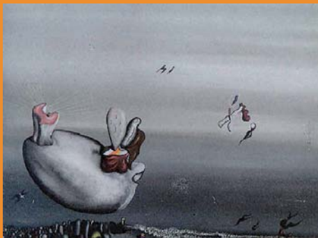
Yves Tanguy, Roux en hiver , 1932

Secondo uno schema già sperimentato con successo, alle conferenze a carattere storico Dialoghi tra le arti , che si terranno da ottobre a novembre 2009, seguirà, tra gennaio e febbraio 2010, una serie di Conversazioni con artisti e fotografi, che discuteranno con i curatori del ciclo e con il pubblico alcuni aspetti della loro poetica e del loro lavoro attuale.