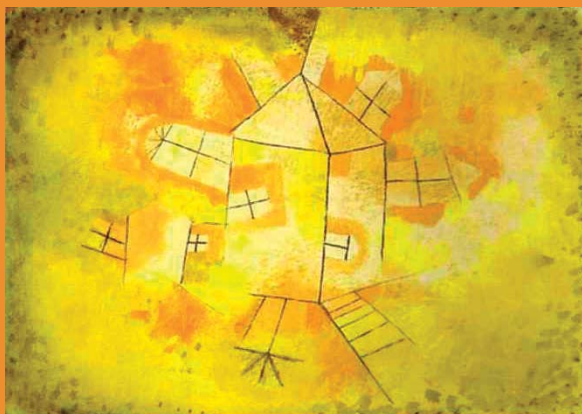
Paul Klee, Casa che gira , 1921