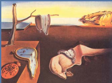
S. Dalí, La persistenza della memoria , 1931