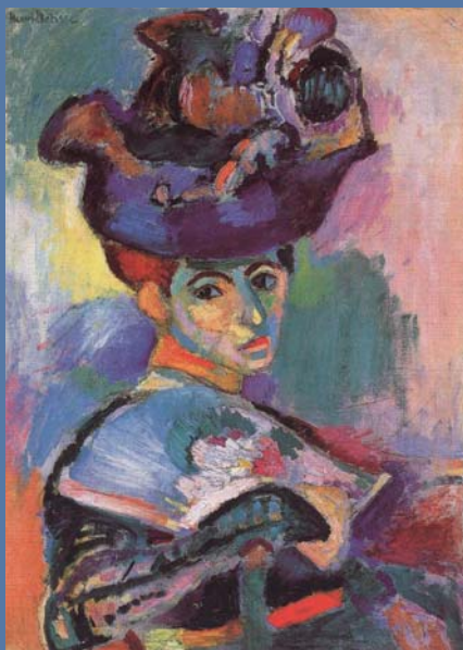
H. Matisse, Donna col cappello, 1905